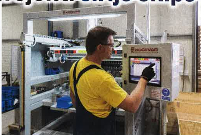
V podjetju bodo zaposlili predvidoma 30 novih sodelavcev.

Njihov trenutno največji projekt je projekt Fisker, električni avto, za katerega izdelujejo aluminijske komponente za podnožje. Velikost prodaje bo na letnem nivoju znašala slabih 20 mio €, letna poraba aluminijskih profilov bo več kot 2.000 ton, kar je več, kot jih sedaj porabijo na celotnem podjetju skupaj, za optimalno pripravo proizvodnje pa je bila potrebna investicija več kot 6 mio €. »Investirali smo v 8 dodatnih sodobnih CNC strojev, ki so postavljeni v avtonomne celice in opremljeni s sodobnimi vpenjalnimi pripravami, roboti za posluževanje ter sodobno